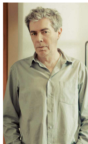
Guido Silvestri, in arte Silver, nato a Modena il 9 dicembre 1952, è l'autore di Lupo Alberto.