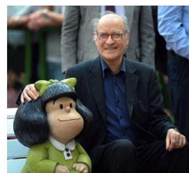
Joaquín Salvador Lavado, in arte Quino, nato a Mendoza il 17 luglio 1932, accanto alla sua Mafalda, e nel suo autoritratto.