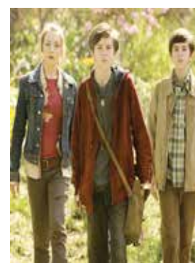
Una scena del film "Spiderwick"